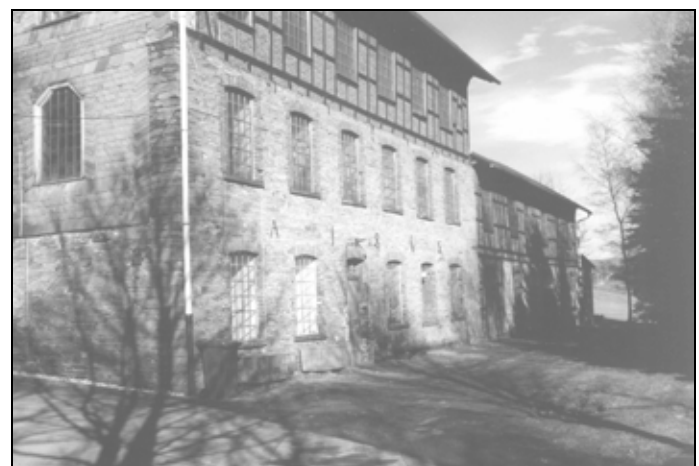
Besteckfabrik Hesse, Fleckenberg: Der Ausbau kann beginnen. Im Investitionsplan '98 wurden zusätzliche Mittel für den Dachgeschoßausbau vorgesehen. Es könnte ein Raum für kulturelle Zwecke (z. B. für Ausstellungen, Konzerte) entstehen.

Wir bleiben damit auch weiterhin unter den „Richtwerten“ des Landes, und wir bleiben mit unseren Erhöhungen auch weiterhin im Kreis der Kommunen, die sich durch niedrige Steuersätze auszeichnen. (...)